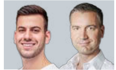
Alexander Valtingoer Coinpanion GmbH