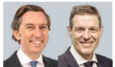
Richard Rella Stage Investsoftware GmbH