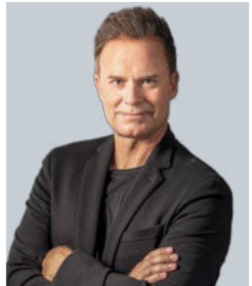
Manuel Horeth, Mentalexperte und Bestsellerautor, wird die faszinierenden Möglichkeiten des mentalen Trainings im Rahmen einer Liveshow aufzeigen (Freitag, 21. Oktober, 19 Uhr).