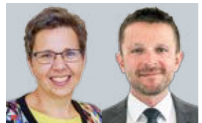
Silvia Frasch LBG Österreich GmbH Steuerberatung Michael Bergmann LBG Österreich GmbH Steuerberatung