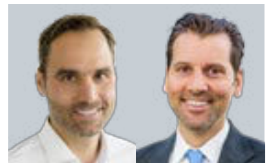
Philipp Arnold Raiffeisen Centrobank AG André Albrecht onemarkets by HypoVereinsbank