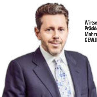
Wirtschaftskammer-Präsident Harald Mahrer eröffnet die GEWINN-Messe.